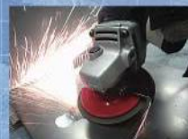
住友スリーエム株式会社 研磨材事業部 研磨布紙ファイバーディスク