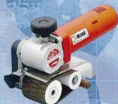
株式会社オフィス・マイン ヘアライン用研磨工具 ローラーミニコHMB-E