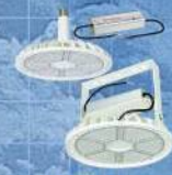
日動工業株式会社 LEDライト