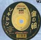
株式会社レタトン 切断砥石 金の卵