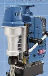
日東工器株式会社 携帯式穴あけ機 アトラエスCLA-2200