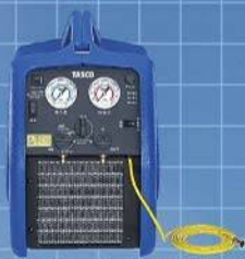
タスコジャパン株式会社 フロン回収装置