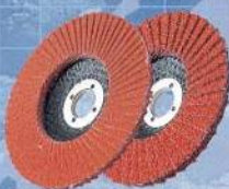
株式会社イチグチ 研磨ペーパー テクノディスク