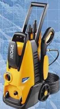
リョービ販売株式会社 高圧洗浄機