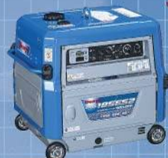
デンヨー株式会社 エンジン発電機GAW-185ES2