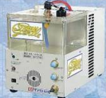
マツモト機械株式会社 冷却水循環装置 ストリームジェントル MP-250B