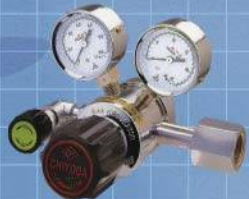
株式会社千代田精機 圧力調整器