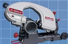
アサダ株式会社 バンドソービーパー