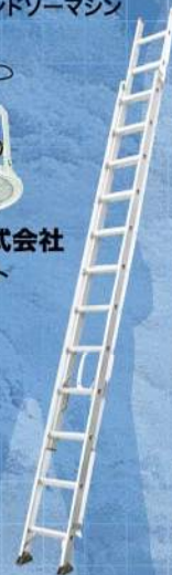
株式会社ピカコーポレーション ハシゴCSM