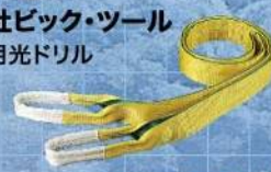
田村総業株式会社 吊り具ベルトスリングZタイプ