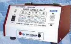
株式会社ケミカル山本 電解式焼取りSUPER SHINER-UNI2