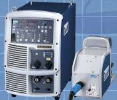
ダイヘン溶接 メカトロシステム株式会社 CO 2 /MAG溶接機ウェルビー-M350L