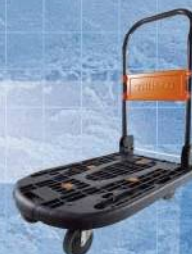
トラスコ中山株式会社 軽量運搬台車カルディオ