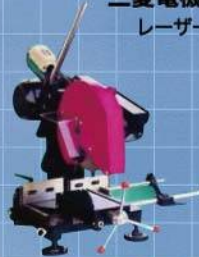
株式会社東京ミタチ チップソー切断機BM405