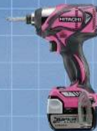
日立工機株式会社 電動工具インパクトドライバー