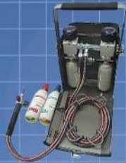
日本液炭株式会社 小型溶接器ミニトーチ