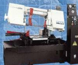
株式会社 ニコテック バンドソーマシン