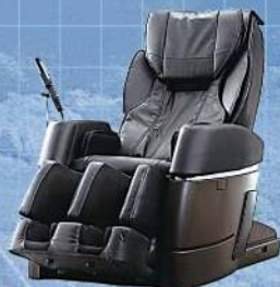
株式会社フジ医療器 マッサージチェア