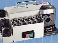
株式会社 ジーネット ドリル研磨機VDG-13A_1