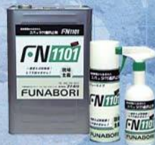
株式会社フナボリ スパッター付着防止剤