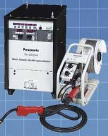
パナソニック溶接システム株式会社 フルデジタル溶接機350GV4