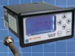
日本エア・リキード株式会社 酸素分析計