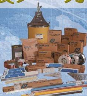
株式会社神戸製鋼所 溶接棒・溶接ワイヤー