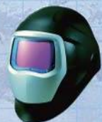
住友スリーエム株式会社 ヘルスケア事業部 溶接用自動遮光面