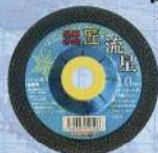
日本レチボン株式会社 切断砥石 飛驒の匠流星